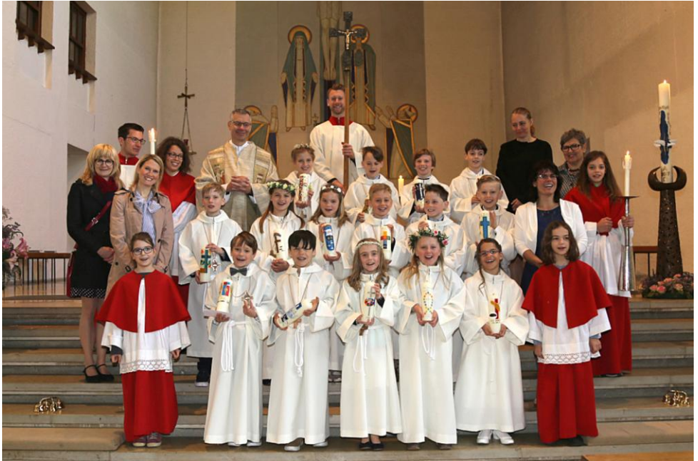
Unsere Kommunionkinder aus der Pfarrei St. Wolfgang