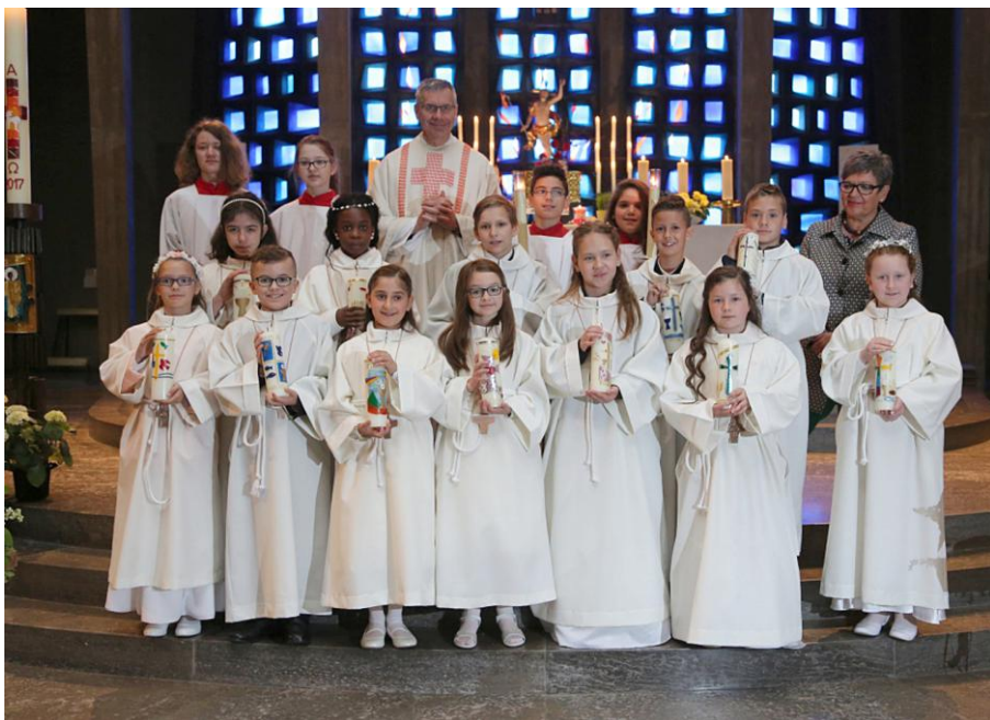
Unsere Kommunionkinder aus der Pfarrei Don Bosco