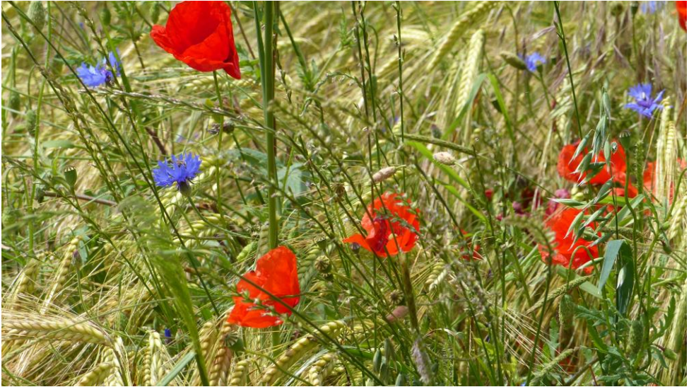
Sommerliches Feld: Gerste, Kornblumen und Mohn