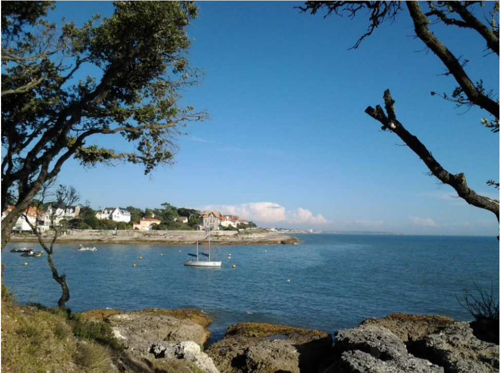
Ferien am Meer, Saint-Palais-sur-Mer, Charente Maritime, Frankreich