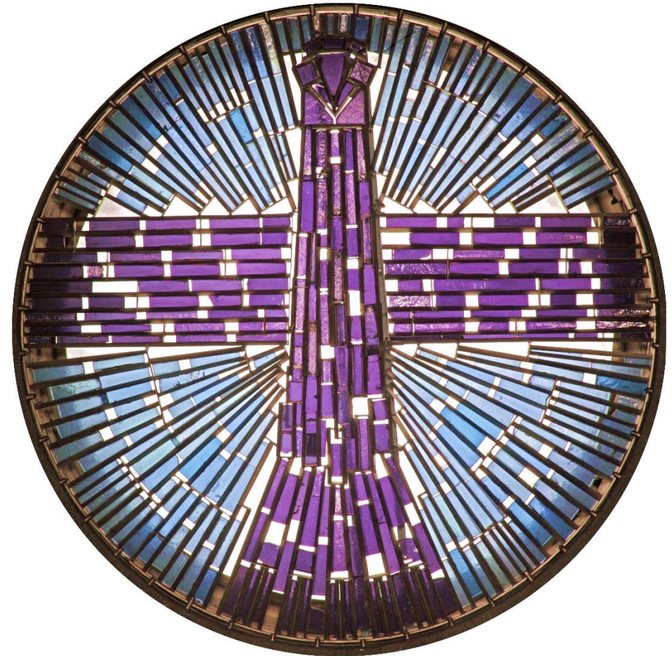
Darstellung des Heiligen Geistes in Gestalt der Taube in der Kuppel der Don Bosco Kirche