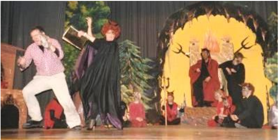
Szenenbild aus »Der vergessene Teufel« 1990,

Im Februar 1990 fragte ich einige spielfreudige Eltern, die zuvor schon für den Kindergarten Don Bosco kurze Märchen einstudiert hatten, ob wir eine Märchenbühne ins Leben rufen könnten. Der Gedanke war, eine Theatergruppe zu gründen, die Märchen aus aller Welt einstudiert um sie einem breiten Publikum vorzuführen, eine Laienspielgruppe, die es in dieser Form in unserer Region noch nicht gab. Die Akteure waren begeistert und sehr motiviert weiterzuspielen. Aus der Idee wurde Wirklichkeit und schon die erste Aufführung des böhmischen Märchens »Der vergessene Teufel« war ein überwältigender Erfolg.