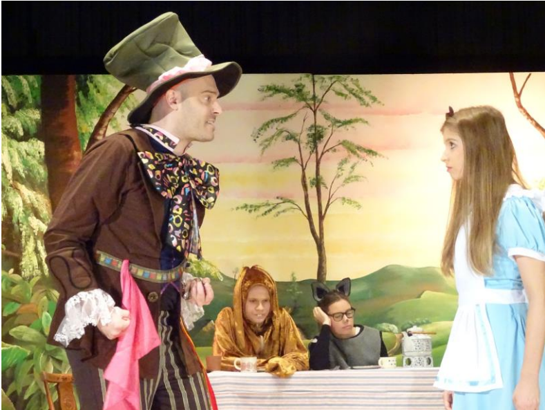
Szenenbild aus »Alice im Wunderland« 2018, Foto: H. Kulhanek

keine Bühnenpräsentation erlebt hatten, wie das diesjährige Stück »Karotten und Blutorangen«.